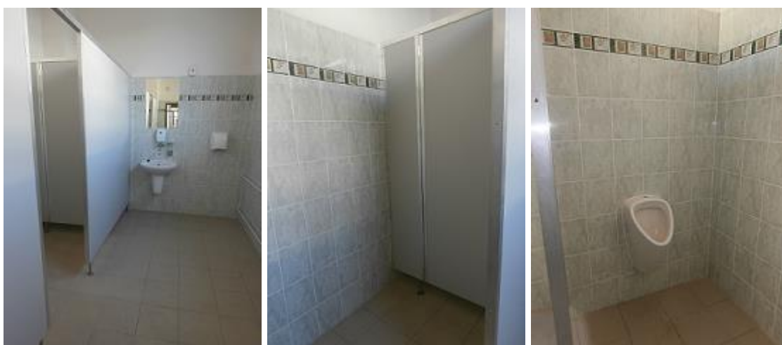
Stávající chlapecké WC ve 2.NP pavilonu D