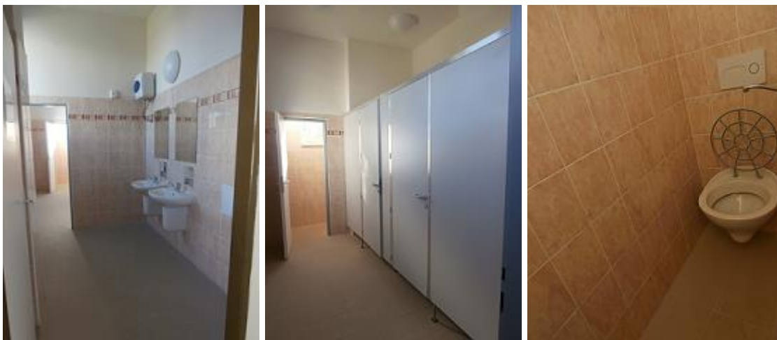
Stávající dívčí WC ve 2.NP pavilonu D