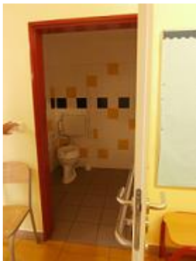
stávající bezbariérové WC ve 4.NP