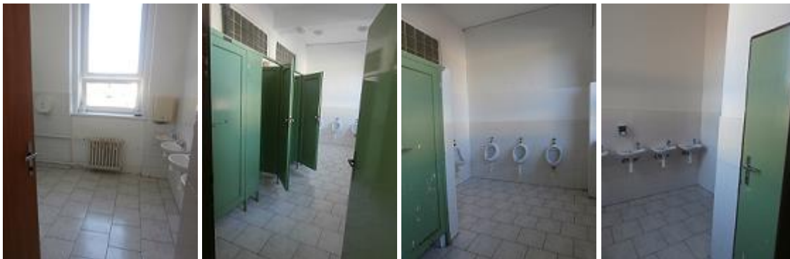
Stávající chlapecké WC 1- 3.NP je identické (možnost zřízení bezbariérového WC)