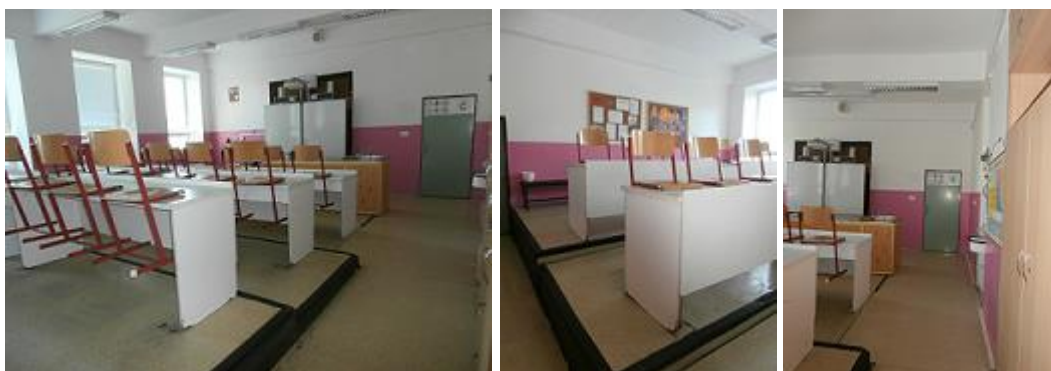
Učebna chemie ve 3.NP