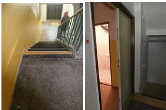
schodiště a vstupní dveře do cvičné kuchyně