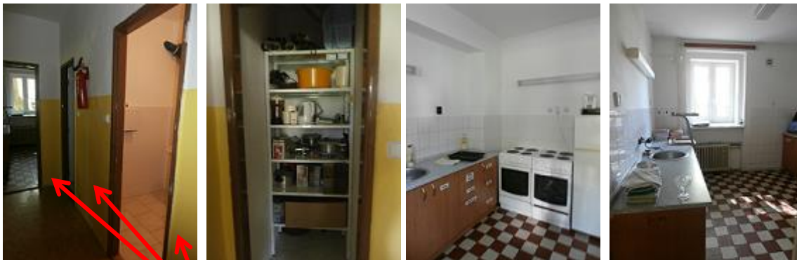
možnost probourání příček ke zvětšení kuchyně