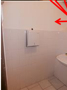
cvičná kuchyň s chodbou, skladem a umývárnou

V rámci úpravy zeleně je zde požadavek na vysazení okrasných rostlin před objektem školy a také instalace bezpečnostních kamer u všech vstupů do objektu.