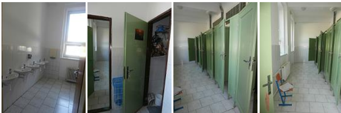
Stávající dívčí WC 1- 3.NP je identické (možnost zřízení bezbariérového WC)