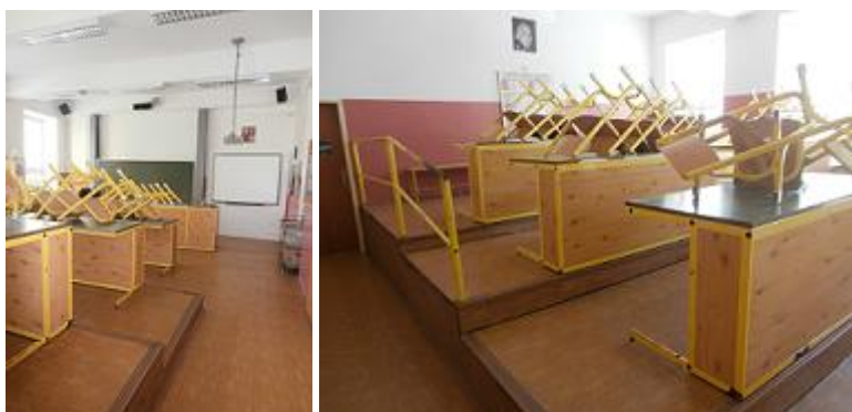
učebna fyziky ve 2.NP