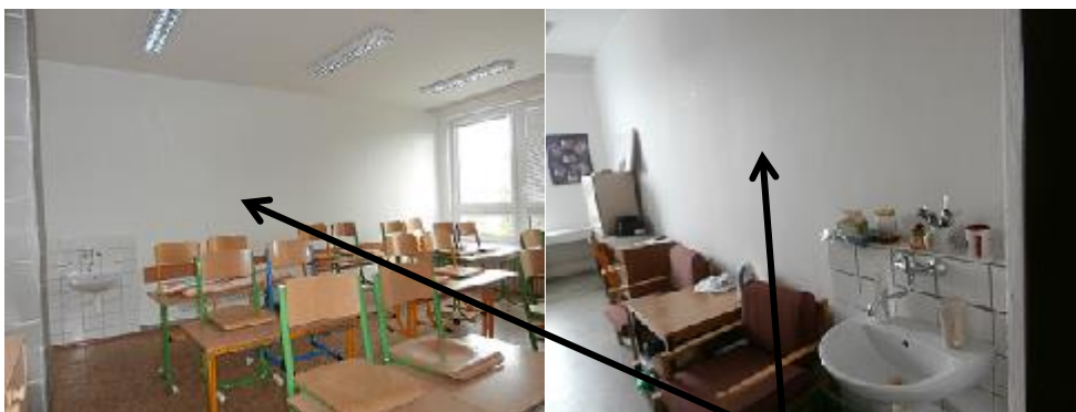
Návrh na jazykovou učebnu ve 4.NP, odstranění příčky