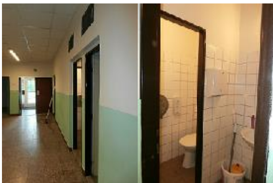
stávající uč. WC v 1.NP v novém objektu