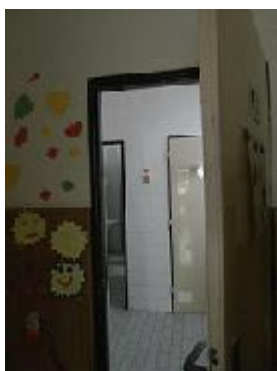
WC ve starém objektu