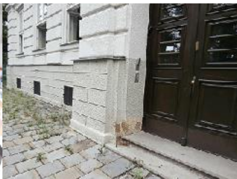
Schodiště do 1.NP a také hlavní vstup do objektu