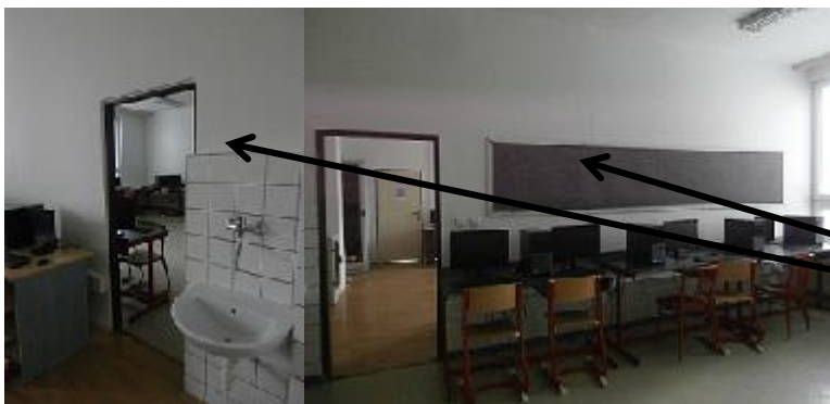
učebna PC ve 2.NP, odstranění příčky