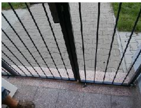
Zadní vstup do objektu, kde je nutné doplnění nájezdové rampy