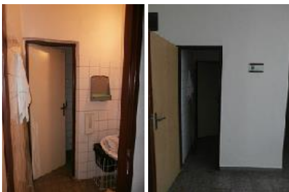
stávající uč. WC v 2. A 3.NP v novém objektu

Všechny prostory dotčené stavebními úpravami budou vymalovány a také bude proveden následný úklid. Ve výše uvedených požadavcích není uvedeno vybavení učeben, to bude vyspecifikováno zvlášť. Tak je tomu i v případě požadavku na konektivitu škol (učeben), ty budou zpracovány odborným dodavatelem. Před zpracování PD je nutná prohlídka všech prostor dotčených stavebními úpravami.