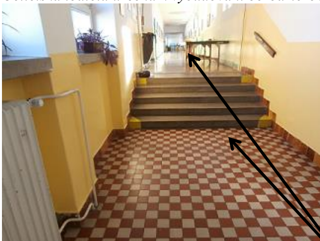
výškový rozdíl ve 3.NP (2x 5stupňové schodiště)